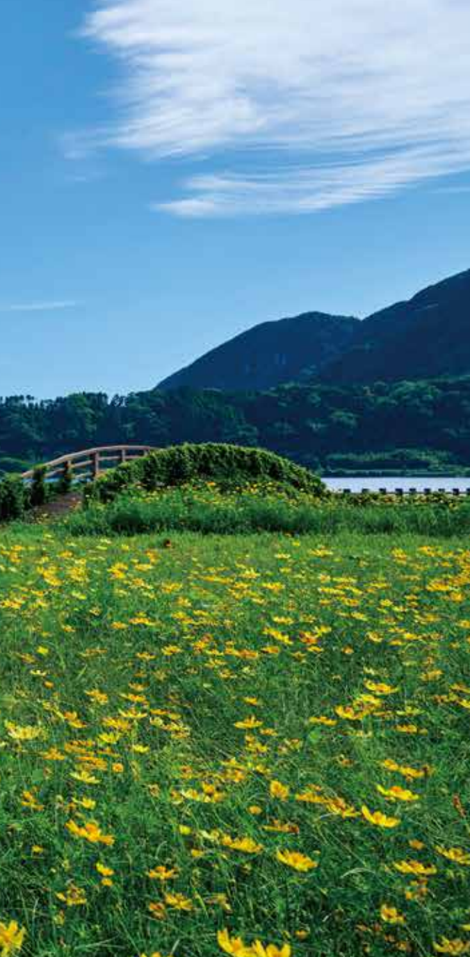
指宿市 Ibusuki City